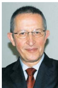
Ferraz , da Editora Frota: as homenageadas integram uma lista de fornecedores de transportes que tiveram a aprovação e o reconhecimento dos próprios clientes

10 transportadoras do seu segmento de atuação, para depois darem suas notas (veja mais sobre a metodologia na Pág. 47), seguiu um padrão: muitos dos embarcadores indicavam até três transportadoras apenas. Na edição 2015, o número de indicações de diversos embarcadores subiu para cerca de sete transportadoras. "Isso mostra que o mercado está mais competitivo, mais fragmentado. Os embarcadores estão em busca de preços mais interessantes, principalmente em função da atual situação econômica que o país atravessa. Assim, as transportadoras maiores passam a ter mais concorrentes, inclusive brigando por mercado com pequenas companhias", analisa Ivone.