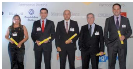
Finalistas do setor de plásticos recebem seus prêmios no Top do Transporte 2015

A indústria de plásticos foi bastante exigente com seus transportadores em 2015 e definiu como Top do Transporte a seguinte ordem: Veneto Transportes (Fone: 11 2131.6400), TW Transportes e Logística (Fone: 54 3330.3900) e a Transportes